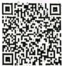
สิ่งการรับฟังความคิดเห็นเพื่อประเมิน ผลสัมฤทธิ์ของพระราชบัญญัติภาษีที่ดิน และสิ่งปลูกสร้าง พ.ศ. ๒๕๖๖